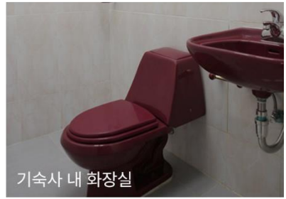
기숙사 내 화장실